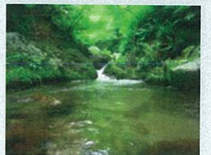
●新緑の五頭で川遊び