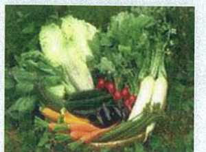
●ゆうきの里の朝採れ健康野菜