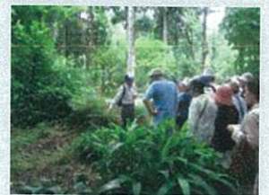
●五頭薬用植物園・森林浴

7:30～8:30 朝食「有機野菜たっぷり膳」 9:00～10:30 「五頭山麓うららの森」の朝市 10:30 薬草と地元の食材で作るギョウザ作りと薬膳蕎麦作り体験・エゴマ搾り体験 11:30 採血 (対象者のみ) 12:00 昼食「薬膳ソバとギョウザ」 13:00 閉校式 13:10 新潟駅へ出発